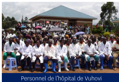
Personnel de l'hôpital de Vuhovi