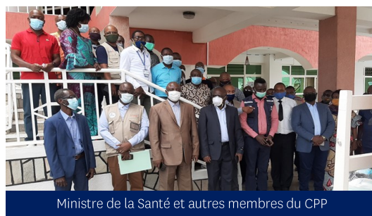
Ministre de la Santé et autres membres du CPP

Face à la COVID-19, les instances de gouvernance sanitaire ont fédéré les efforts de la po-