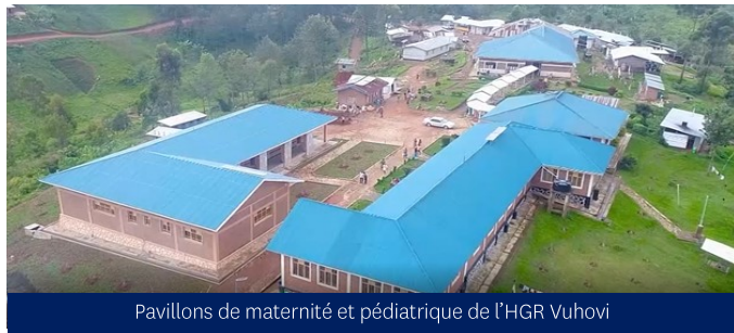
Pavillons de maternité et pédiatrique de l'HGR Vuhovi

À ce jour, 12 cycles — 2544 personnes/jours de formation ont été réalisés sur plusieurs thématiques : échographie gynéco-obstétricale, risque infectieux, réa néonatale, maintenance biomédicale, urgences médicales, malnutrition, MVE, COVID-19, marche humaniste en soins... ▼