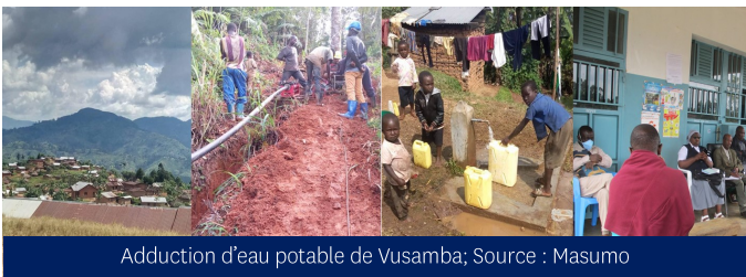
Adduction d'eau potable de Vusamba; Source : Masumo

En plus des 27 infrastructures sanitaires et adductions d'eau déjà réalisées, 2 pavillons pédiatriques (HGR Manguredjipa et HGR Vuhovi) et une adduction d'eau de 13 km pour le Centre de santé et la population de Vusamba (15.000 habitants) ont été finalisés en 2020. ▼